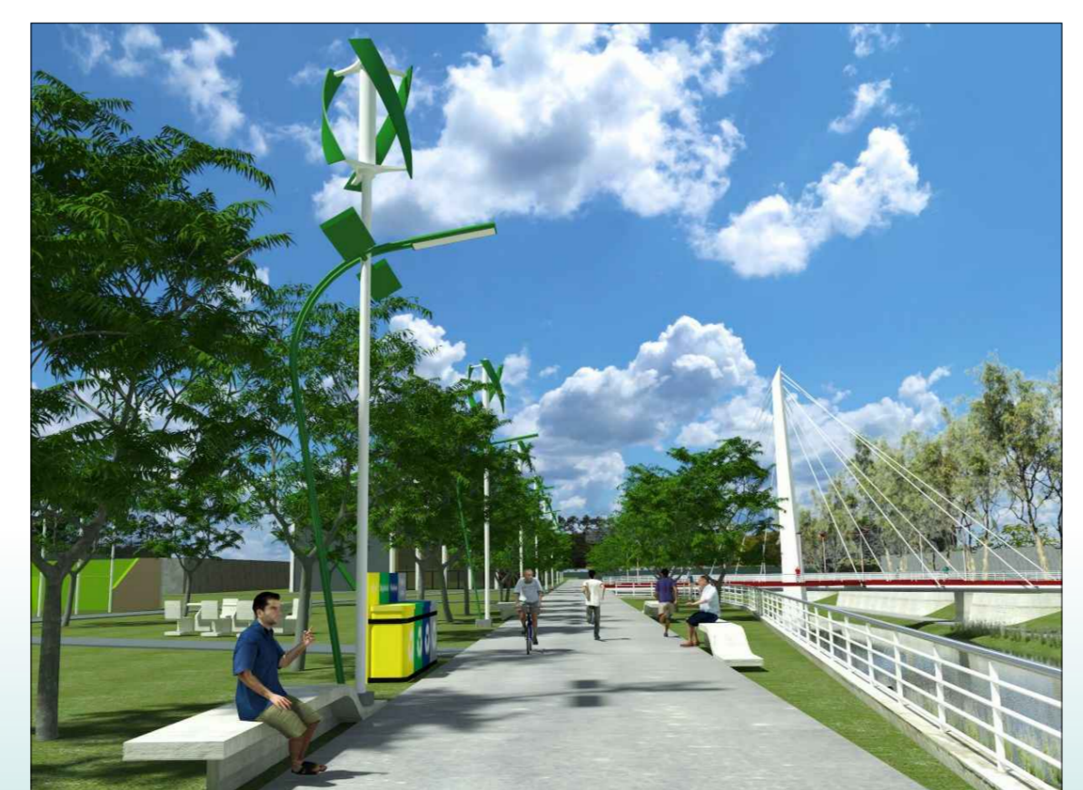
2. El paseo sobre la margen Norte